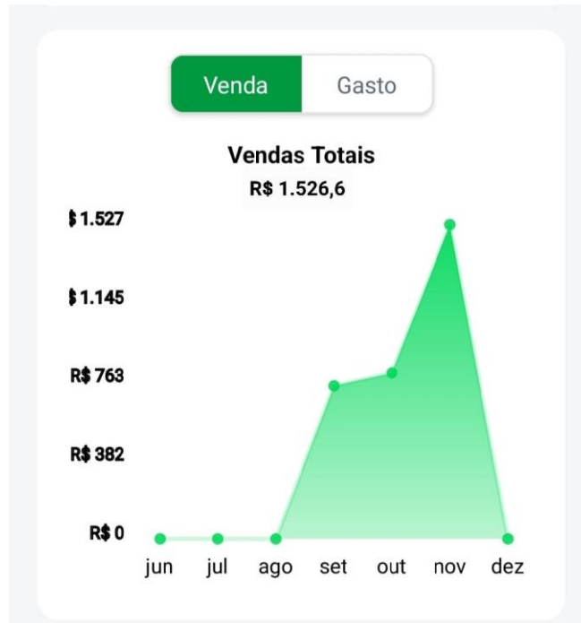
Figura 2. Gráfico de vendas.

Foram registradas as vendas da empresa nos meses de setembro, outubro e novembro.