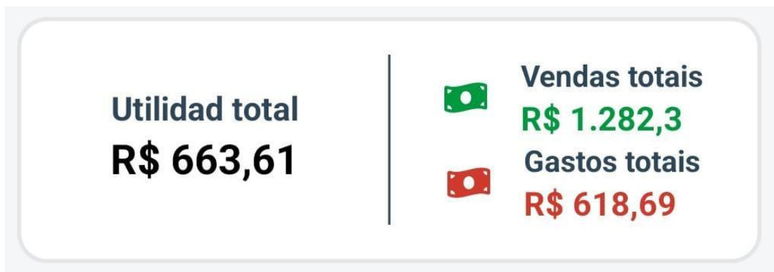
Figura 3. Valor de vendas, gastos, lucros.

Através dos dados registrados no aplicativo, como os documentos (notas fiscais) dos produtos adquiridos e pagamentos de despesas e/ou produtos adquiridos de forma parcelada, a empresa obteve o resultado de 51,8% de lucro com as vendas, de acordo com a imagem 3.