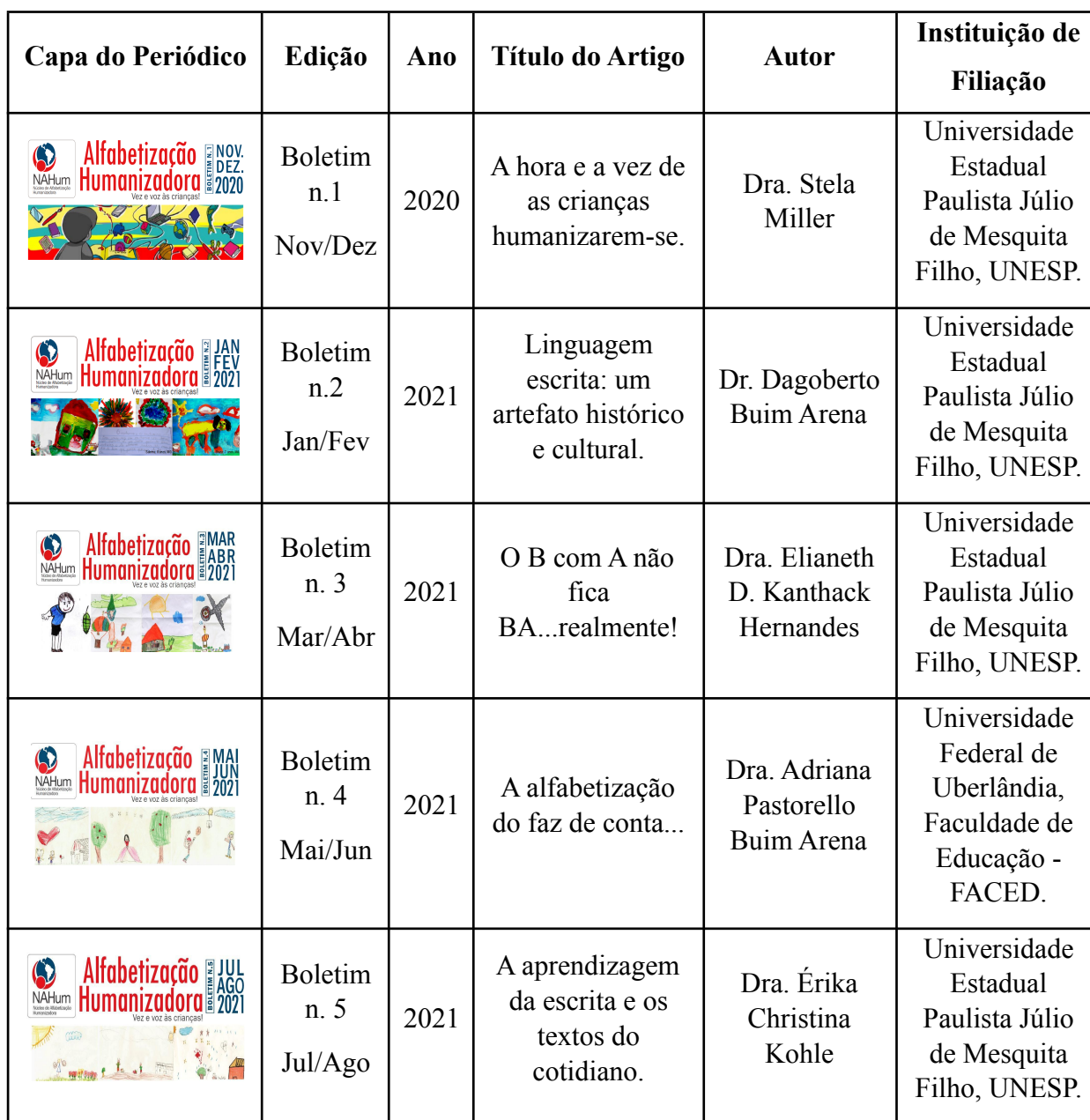
QUADRO 3 – Material da pesquisa.

A seguir, apresentamos um quadro contendo os 7 periódicos do boletim de Alfabetização Humanizadora – NAHum – Veze e voz às crianças! publicados entre novembro/dezembro de 2020 e novembro/dezembro de 2021, na sessão “ De professor para professor ”, coletados diretamente da página web de divulgação dos conteúdos do Núcleo de Alfabetização Humanizadora.