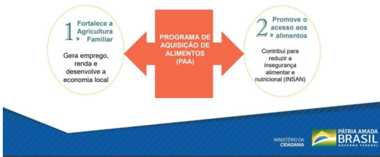
Imagem 02: uns dos objetivos do Programa de Aquisição de Alimentos – PAA

As entidades tem a oportunidade de acessar essa política pública para atender seus beneficiários. No entanto o Programa em suas diretrizes exige que a entidade tenha inscrição no conselho de assistência social, apresente a documentação da entidade, faça o cadastro no (quando o programa é pela CONAB), e apresente um cadastro que demonstre o público atendido e as refeições ofertadas. A orientação do programa consiste em atender as entidades em caráter suplementar, ou seja, a ofertada alimentação seja por conta da entidade, o programa chega para contribuir, ou melhor complementar, respeitando as vulnerabilidades sociais, atendendo os valores nutritivos conforme a orientação nutricional (CONAB, 2018).