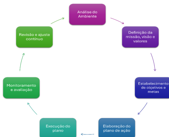
Gráfico 1 – Etapas do processo do planejamento estratégico no setor público.

Conforme ilustrado no Gráfico 1, as etapas do processo de planejamento estratégico no setor público envolvem a definição da missão institucional, a formulação de objetivos, a escolha de indicadores de desempenho, a execução das estratégias e a avaliação dos resultados. Esse ciclo retroalimenta a gestão pública, possibilitando ajustes contínuos e a aprendizagem organizacional, em consonância com a teoria de Mintzberg (2006) sobre a interação entre estratégias deliberadas e emergentes. Kaplan e Norton (1997), introduziram o Balanced Scorecard (BSC) como ferramenta para integrar o planejamento estratégico aos sistemas de avaliação de desempenho. Embora tenha origem no setor privado, o BSC tem sido amplamente adotado em órgãos públicos brasileiros, como o Tribunal de Contas da União (TCU) e o Ministério da Economia, justamente por permitir a visualização integrada dos objetivos institucionais. No gráfico 1, observa-se as etapas que compõem o processo de planejamento estratégico no setor público, segundo Kaplan e Norton.