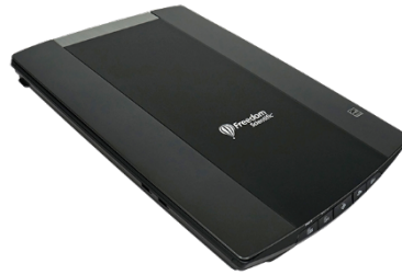
Figura 5 - Scanner