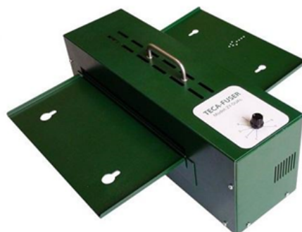
Figura 7 – Fusora