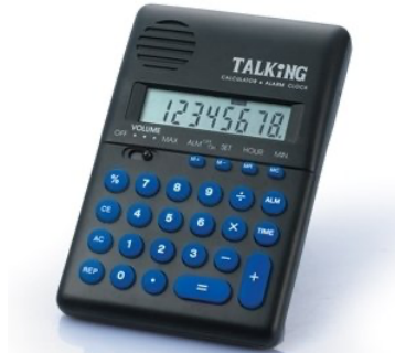
Figura 8 – Calculadora Sonora