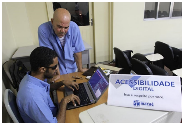
Figura 1- Leitor de tela