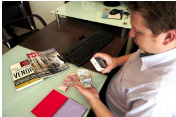
Figura 3 - Vocalizer