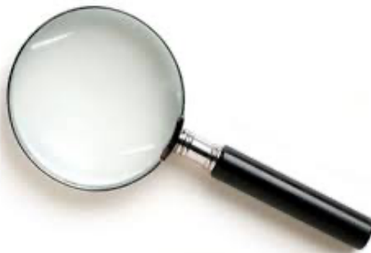
Figura 11 – Lupa de aumento

Fonte: http://www.pratikadistribuidora.com.br/acessibilidade