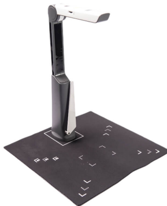
Figura 4 - Readit