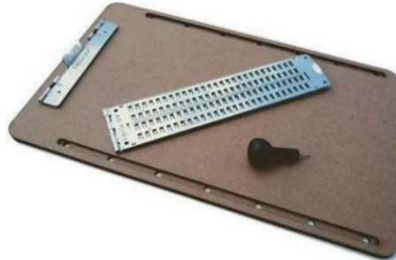
Figura 10 – Reglete e punção