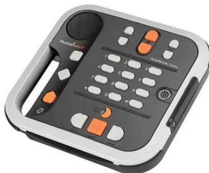
Figura 2 - Victor Reader Stratus