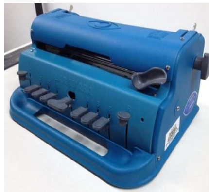
Figura 6 – Máquina de Braille

d) Máquina Braille - Aparelho utilizado para a impressão de textos em Braille.