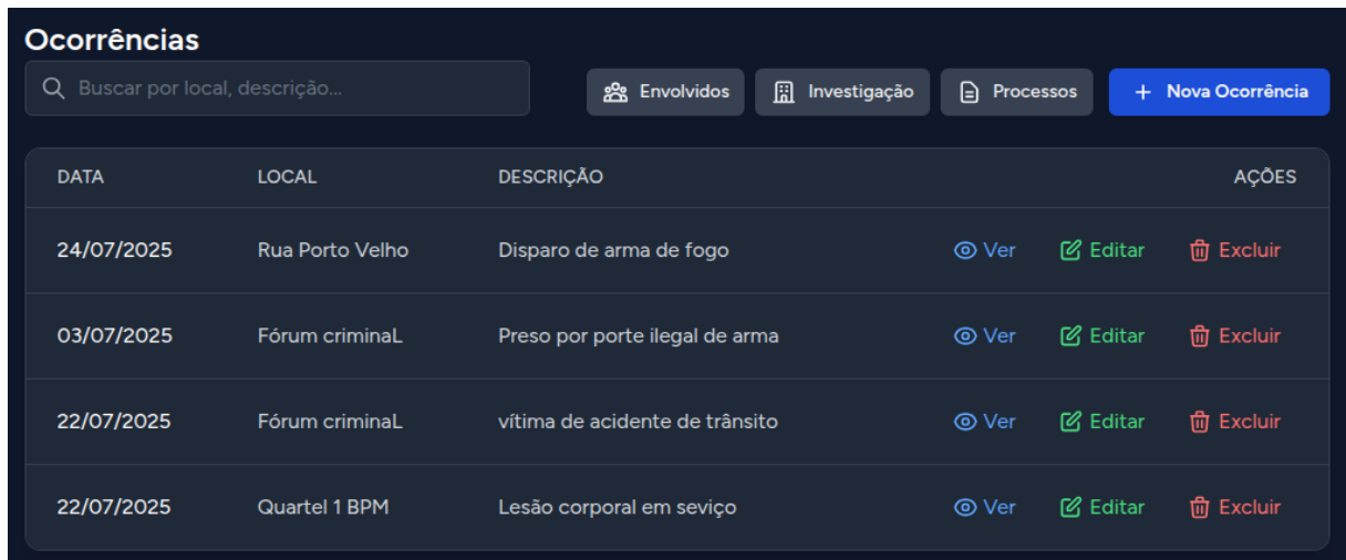
Figura 9 – Módulo Ocorrências

Há uma seção específica para cadastros de ocorrências, investigações e processo em andamento. A tela (Figura 9) demonstra o Módulo Ocorrências.