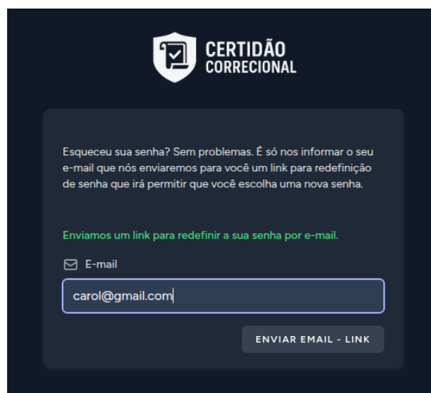
Figura 6 – Recuperar senha

A a tela (Figura 6) ilustra o processo de envio de pedido de recuperação de senha e a resposta recebida.