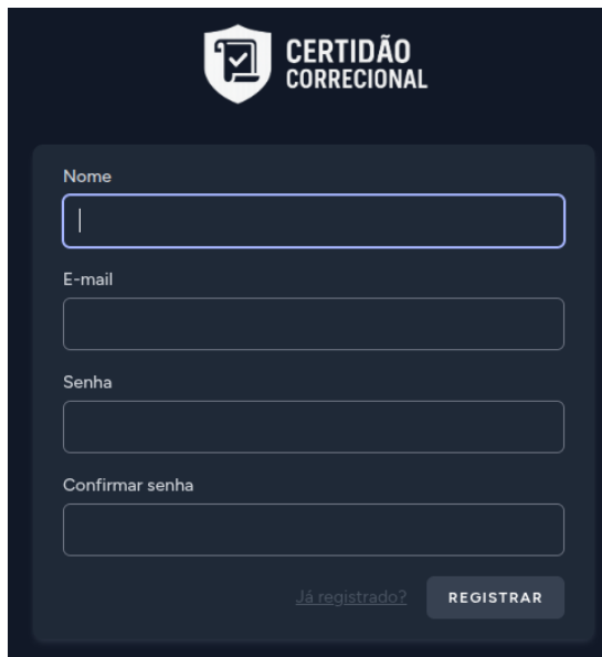
Figura 4 – Cadastrar usuário

(Figura 4), recebendo permissão de usuário padrão.