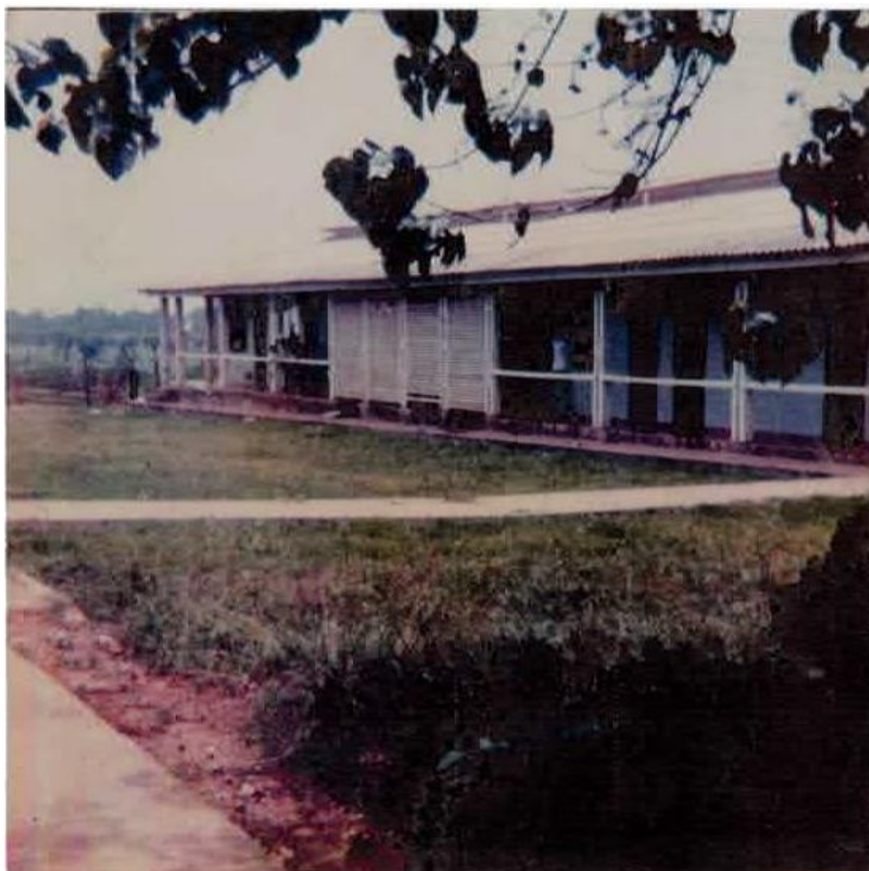
Figura 2 – Escola Agrotécnica Estadual Silvio Gonçalves de Faria