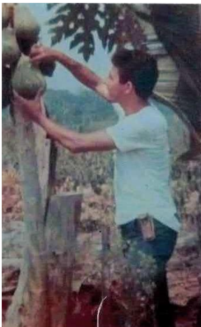
Figura 3 – Escola Agrotécnica Estadual Silvio Gonçalves de Faria

Fonte: Arquivo pessoal de Juscelino Gomes de Miranda (1987).