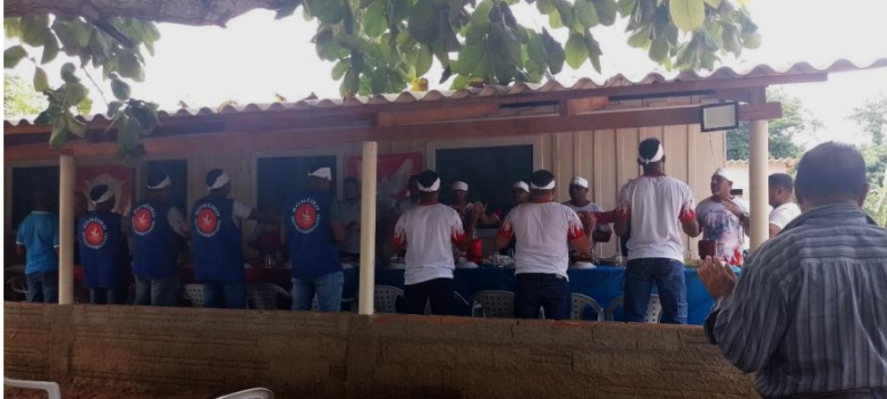
Figura 20: Momento de oração antes do almoço

almoço. Após o almoço, houve uma pausa de descanso e também para a troca de turno de romeiros, do mestre dos foliões e dos foliões.