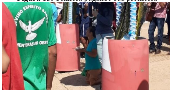
Figura 15: Senhora pagando sua promessa