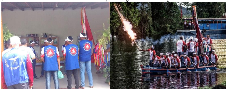
Figuras 11 e 12: Romeiros identificados com coletes lenços e Fogos de artifício que anunciam os momentos da chegada