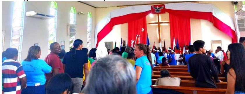
Figura 26: Devotos em despedida e ofertando suas esmolas ao Santo