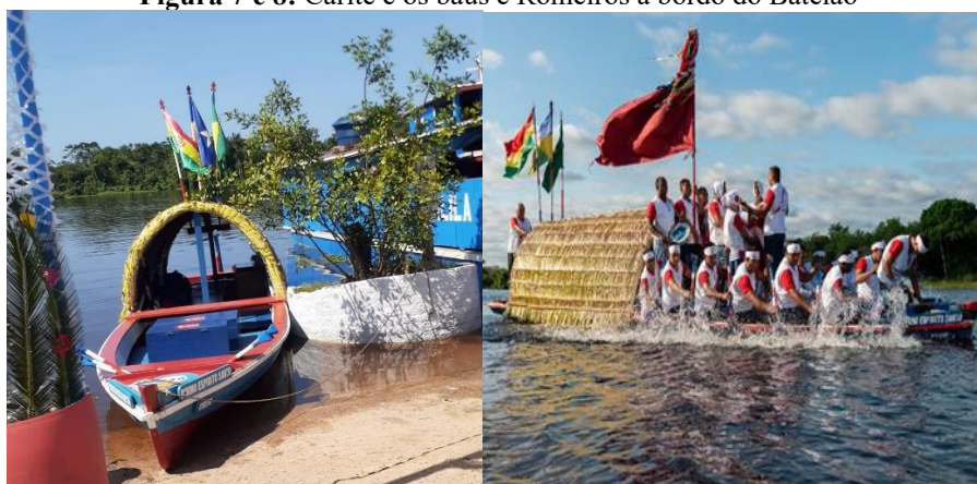
Figura 7 e 8: Carité e os baús e Romeiros a bordo do Batelão

O “Batelão”, chamada também de “Carité” que para os componentes quer dizer “igreja”, é onde a Coroa do Divino Espírito Santo permanece durante toda a viagem, saindo somente para ser entregue às comunidades durante sua caminhada. Este barco além de transporte se torna uma capela fluvial abençoada, a qual conduz com ajuda dos remos (além de ajudar no deslocamento pode ser utilizado para jogar água em sinal de saudação aos fiéis) os símbolos e os romeiros da aclamada festividade religiosa. Na Carité, há dois baús que servem para guardar a Coroa após a finalização do festejo e o dinheiro fruto das esmoladas oferecidas pelos devotos.