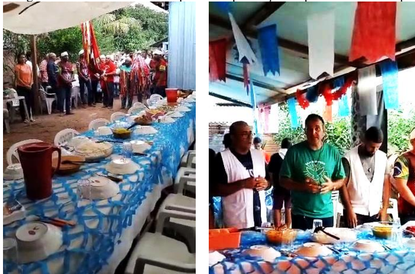
Figuras 24 e 25: Chegada do Santo na casa do Imperador e presença dos padres durante a partilha de alimentos

No dia 04, todos se preparavam com os corações apertados para a saída do Divino Espírito Santo. De início houve o café da manhã, seguido da peregrinação nas últimas casas a serem visitadas naquela manhã, com parada para o almoço na casa do Imperador João de Brito. Muitos devotos foram prestigiar a última refeição e os últimos momentos do Divino Espírito Santo na cidade, aguardando o descanso e a saída para a igreja para uma derradeira veneração.