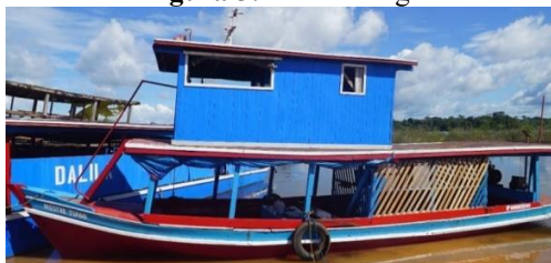
Figura 5: Mestre Tiago

O “Mestre Tiago” demonstra um motor de alta potência ao qual transporta as outras embarcações (anexadas), guarda também o gerador de energia. O mesmo possui um pequeno alojamento aos quais ficam hospedados: o comandante do barco, zelador, Alferes da bandeira, encarregado da Coroa e o motorista.