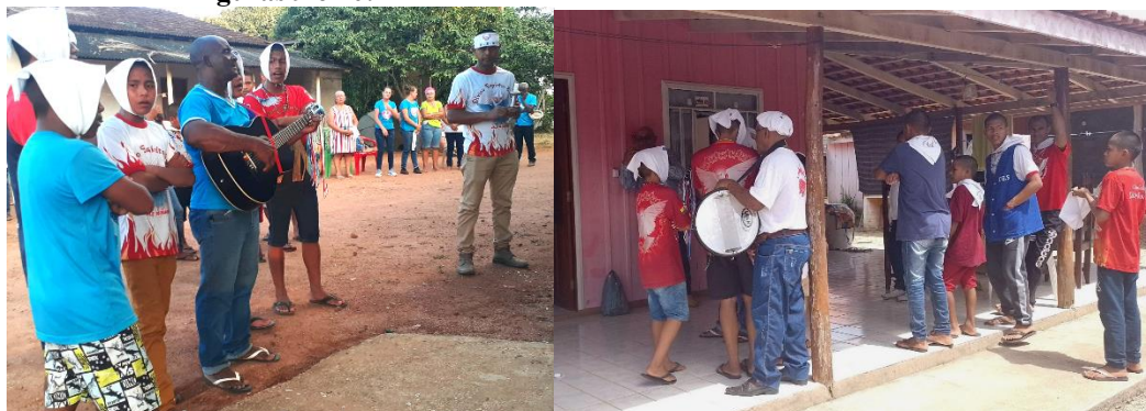
Figuras 9 e 10: Primeiro mestre e seu violão e Caixaeiro e seu tarol

tarol também fica reproduzido em todos os momentos da peregrinação. Dependendo da exigência e local da comunidade, são utilizados lenços e coletes geralmente brancos ou azuis, em forma de identificação dos romeiros.