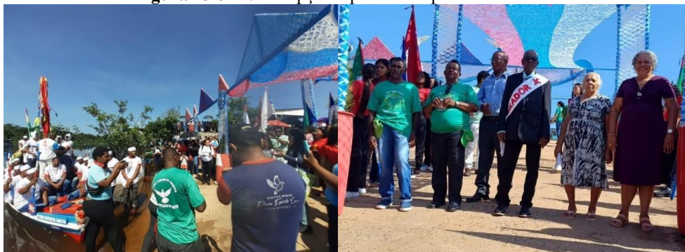
Figura 13 e 14: Recepção e pessoas importantes da festa

Os momentos de passagem do Divino Espírito Santo pelas casas, ruas e igreja, foram registros e acompanhados pela pesquisa, através de fotografias, entrevistas e diálogos com os participantes na romaria.