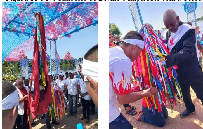
Figura 16 e 17: Símbolos do Divino e Imperador com a Coroa

Após a Romaria do Divino Espírito Santo, ancoram-se no porto da cidade todos os componentes, sendo esses remeiros, encarregado da coroa, encarregado do batelão, alferes da bandeira, caixeiros, mensageiros, foliões, padres, mestres e saveiros, descem da carité com os três símbolos ícones do Divino: a Bandeira, o Cetro e a Coroa. Ainda na chegada ao porto, o Santo é venerado primeiramente pelo Imperador que tornará a conduzir a coroa e a Imperatriz que conduzirá o Cetro, e posteriormente se dá a veneração aos promesseiros. No ritual de veneração, todos andam de joelhos e beijam os três símbolos do Divino.