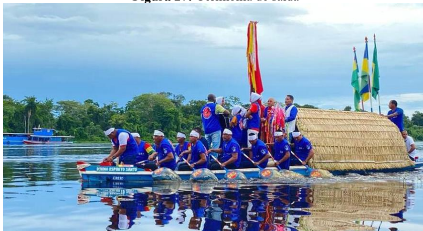
Figura 27: Cerimônia de saída

À medida que vão se despedindo da Romaria do amado Senhor Divino Espírito Santo, (fotografia a seguir), os fiéis permanecem cantando e adorando, até que as embarcações não possam mais ser vistas em seu campo de visão, e assim se despedem, não com um adeus, mas sim com um “até breve”, pois ele, O Divino Espírito Santo permanece presente e sempre vivo em seus corações. É notado que essa festa, permite, ainda, além da simbologia, a certeza que os fiéis remetem a presença Divina. Segundo os relatos, é como, que, as águas levem em seu curso, todos os problemas, angústias e preocupações, renovando suas esperanças e forças para lidar com as adversidades que a vida proporciona no cotidiano.