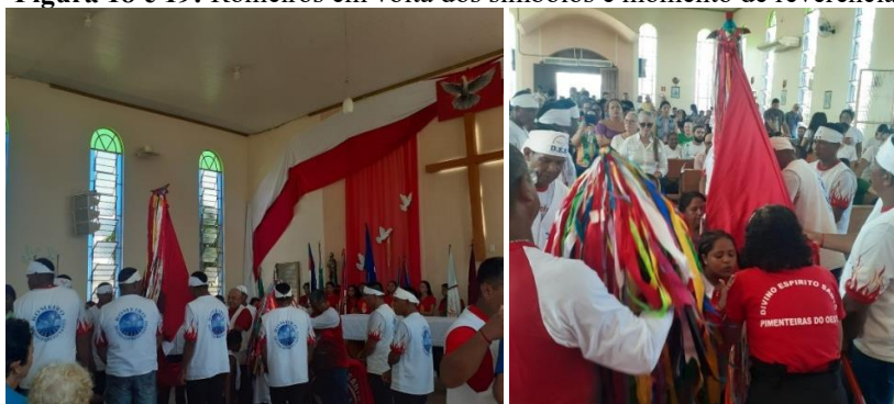
Figura 18 e 19: Romeiros em volta dos símbolos e momento de reverência