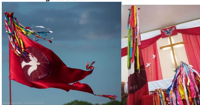
Figuras 3 e 4: Bandeira - Cetro e Coroa

A bandeira do Divino é de cor vermelha, e contém o símbolo do Espírito Santo estampado em seu centro, uma pomba branca que representa pureza, paz e a presença divina. Ainda junto à Bandeira no mastro, simboliza confiança e credita dos fiéis, são amarradas pelos devotos ao longo da celebração inúmeras fitas coloridas, com o intuito de assegurar seus votos, geralmente em cores que reforçam virtude divina, sendo vermelha para simbolizar a caridade, verde a esperança, azul diz respeito à fé, branca representa a paz, amarela exprime a sabedoria, rosa remete à beleza, roxa reflete a justiça. Outro símbolo ícone da Romaria é a coroa dourada que simboliza o poder do imperador e humildade. Já o cetro, além de poder, representa o respeito ao comando do império real e humilhação.