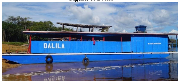
Figura 6: Dalila

A “Dalila” é uma pequena balsa, a mesma serve de alojamento aos outros componentes e devido ao grande espaço, ainda comporta cozinha, banheiro e um porão de depósito para suprimentos.