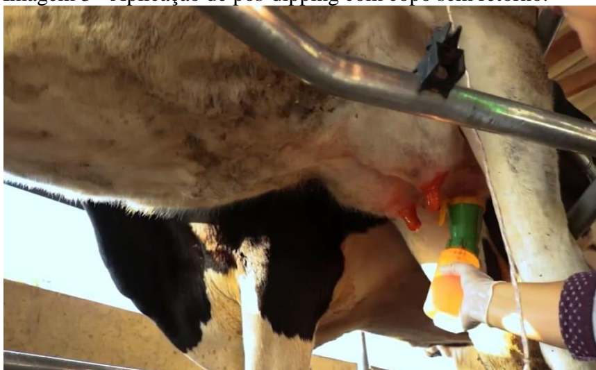
Imagem 3 - Aplicação de pós-dipping com copo sem retorno.