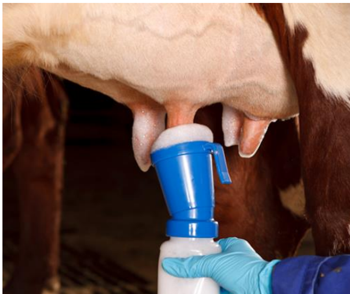
Imagem 2 - Aplicação de pré-dipping com copo sem retorno.