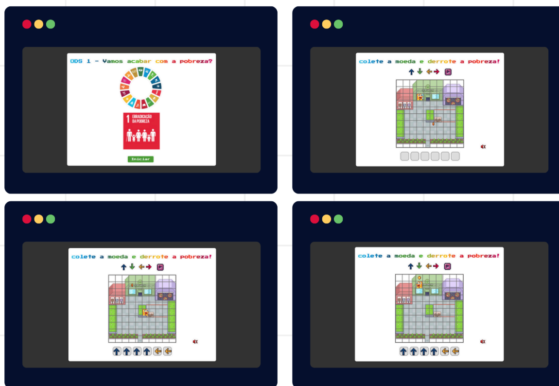
Figura 5. Fase 01 do jogo