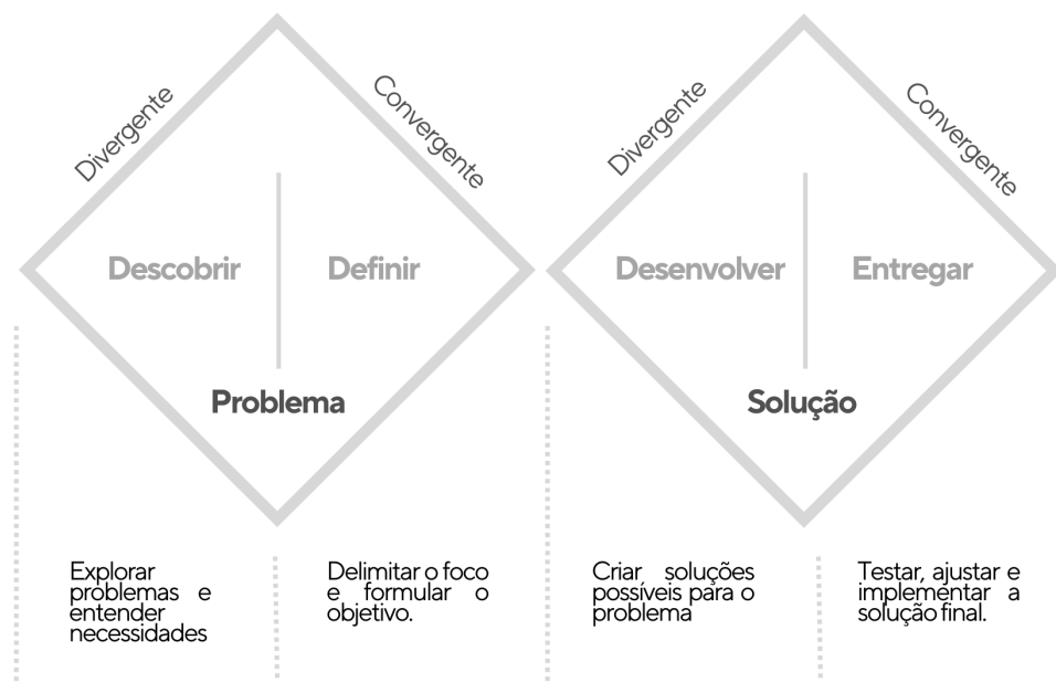
Figura 1. Modelo Duplo Diamante

O modelo do DD, desenvolvido pelo Design Council em 2004, é uma abordagem iterativa e não linear, especialmente eficaz para projetos que exigem adaptação contínua, ajustes frequentes e feedback constante. Sua estrutura favorece a flexibilidade no desenvolvimento, permitindo que soluções sejam refinadas ao longo do processo. O modelo organiza o design em quatro etapas principais, apresentadas nas subseções a seguir, guiando a exploração do problema e a construção de soluções de forma estruturada e dinâmica [Castanho et al. 2018; Nascimento e Albuquerque 2015].