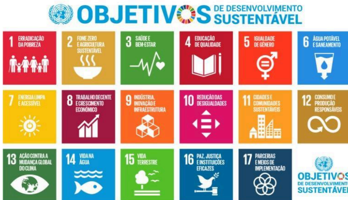
Figura 2. Os 17 Objetivos de Desenvolvimento Sustentável da ONU

Neste contexto, a escolha dos ODS como tema principal do jogo está alinhada com sua importância no cenário educacional atual, visto que esses conteúdos vêm sendo incorporados gradualmente às práticas pedagógicas da educação básica. No Ensino Fundamental I, os ODS são trabalhados de maneira integrada ao currículo, especialmente em áreas como Ciências, Geografia e História, por meio de tópicos como sustentabilidade, cidadania, consumo responsável e igualdade de direitos.