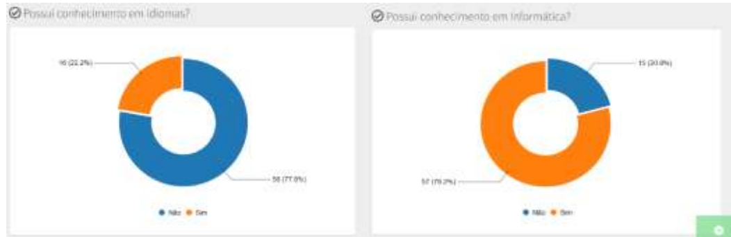
Figura 06 - Conhecimentos de informática e idiomas curso gestão públicas, ingressantes 2020.