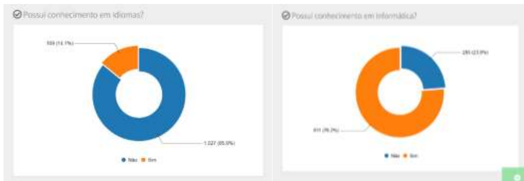
Figura 07 - Conhecimentos de informática e idiomas curso gestão públicas, ingressantes 2021.