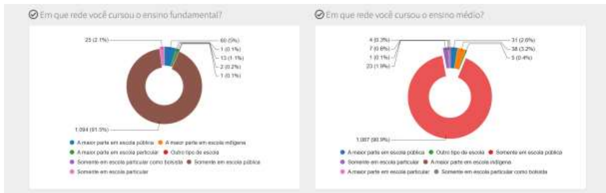
Figura 05 - Indicadores de rede de ensino fundamental e médio, alunos ingressantes 2021 no curso de Gestão Pública.