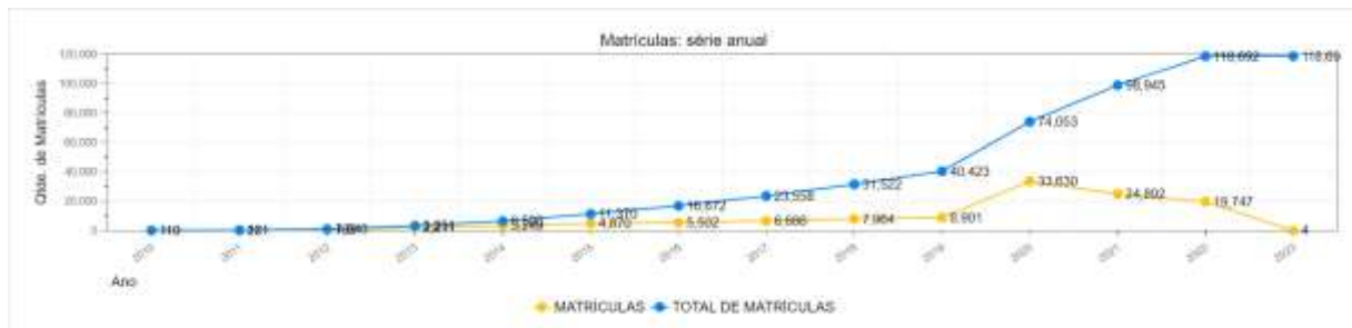
Gráfico 01 – Crescimento de matrículas no auge da COVID-19.