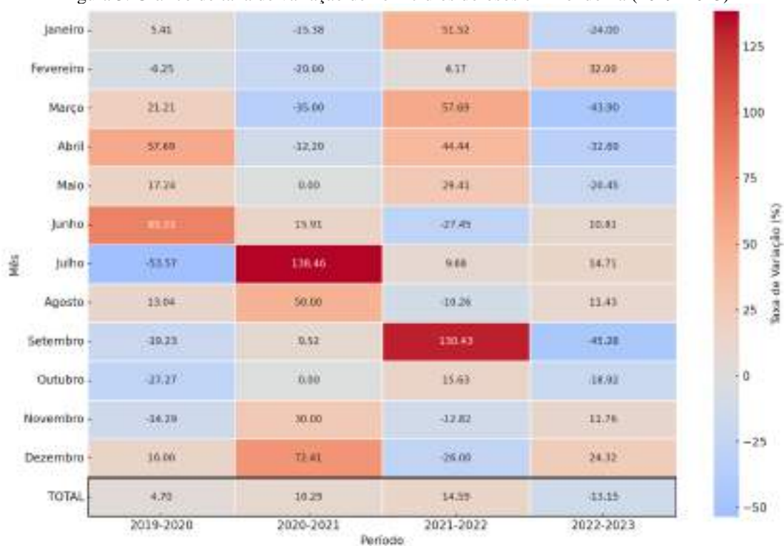
Figura 3. Gráfico de taxa de variação de homicídios dolosos em Rondônia (2019–2023)