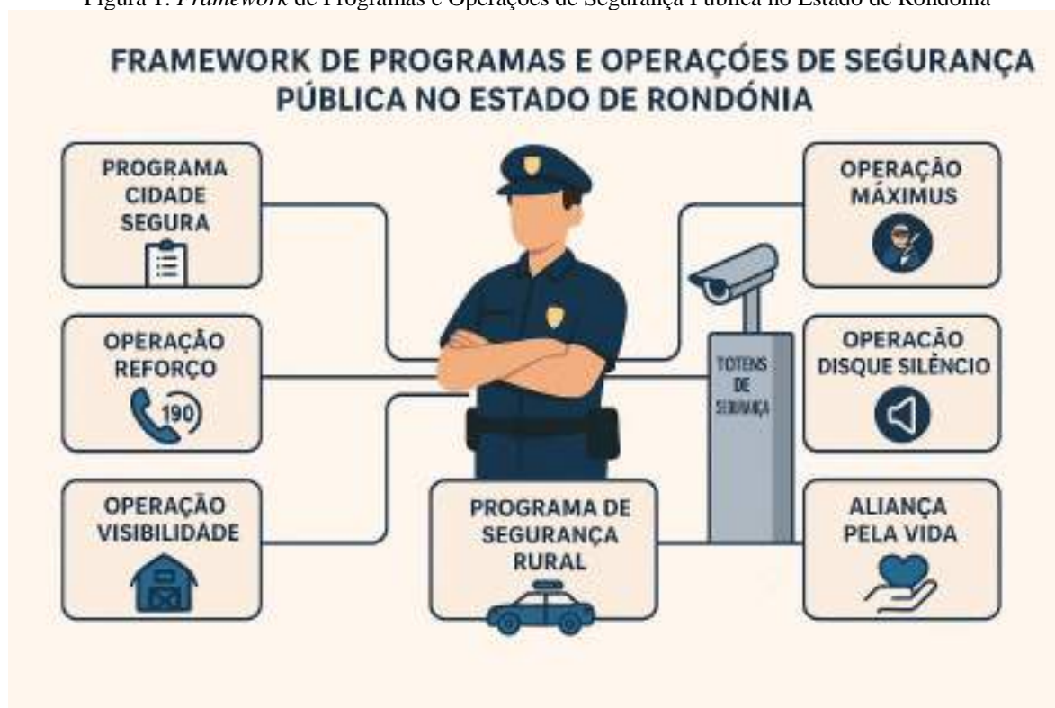
Figura 1. Framework de Programas e Operações de Segurança Pública no Estado de Rondônia

Não obstante, ao longo do último ano, o Governo do Estado investiu em tecnologia de ponta, equipamentos, contingente, treinamentos e cursos na Secretaria de Segurança, Defesa e Cidadania (Sesdec), como ilustrada e organizada a seguir (FIGURA 1).