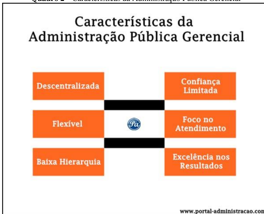
Quadro 2 – Características da Administração Pública Gerencial