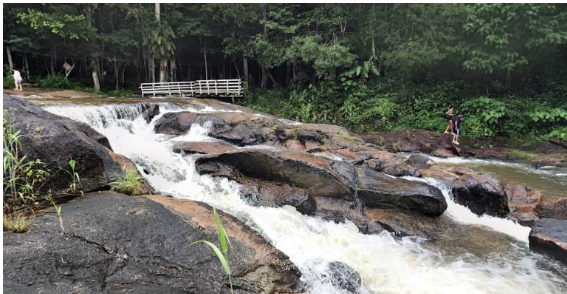
Figura 6 – A Cachoeira do Protázio.