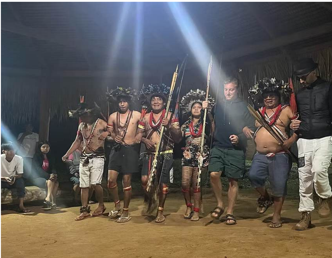
Figura 7 – Luciano Huck e sua interação com o turismo indígena Paiter Suruí.