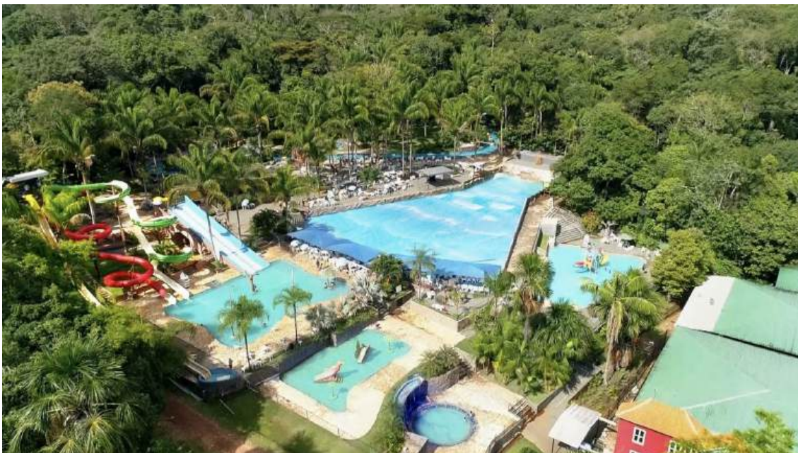
Figura 8 – O Acqua Park.