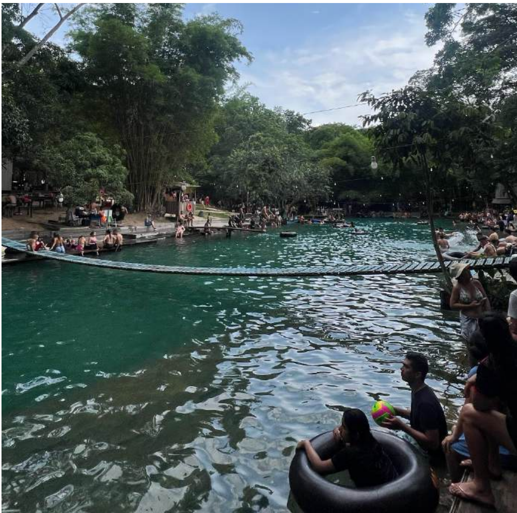
Figura 3 – A Lagoa Azul como um espaço de lazer.