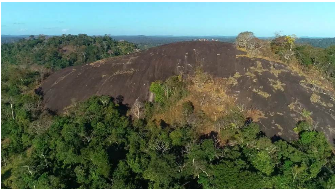
Figura 2 – Dimensão da Pedra da Linha 10.