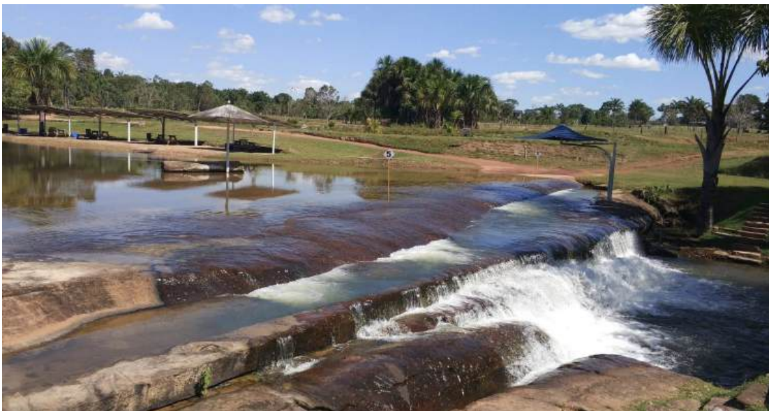
Figura 4 – Sítio Bola de Ouro.