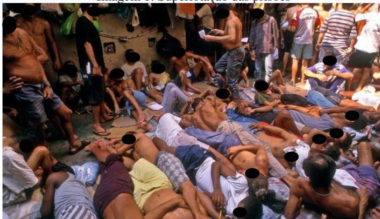
Imagem 1: Superlotação das prisões

Desde a promulgação da Lei de Execução Penal (LEP) em 1984, o direito à saúde das pessoas privadas de liberdade (PPL) foi estabelecido no contexto legal brasileiro (BRASIL, 1984). No entanto, conforme discutido por Batista e colaboradores (2019), apesar dos avanços legislativos, a implementação da assistência à saúde específica para essa população tem sido precária, caracterizada por ações inadequadas e desarticuladas. A Constituição Federal de 1988 reforçou esse direito, considerando a saúde como dever do Estado e direito de todo cidadão, inclusive dos que estão em conflito com a lei, o que possibilitou a criação de políticas e programas voltados para a saúde no sistema prisional (BRASIL, 1988). O Plano Nacional de Saúde no Sistema Penitenciário (PNSSP) e, posteriormente, a Política Nacional de Atenção Integral à Saúde das Pessoas Privadas de Liberdade no Sistema Prisional (PNAISP) foram instituídos com o objetivo de proporcionar uma atenção abrangente à saúde das PPL, seguindo os princípios do Sistema Único de Saúde (SUS). Apesar desses esforços, como destacado por Soares e Bueno (2016), uma minoria das PPL era atendida pelas equipes de saúde no sistema prisional, evidenciando falhas na execução das políticas de saúde para esse grupo.