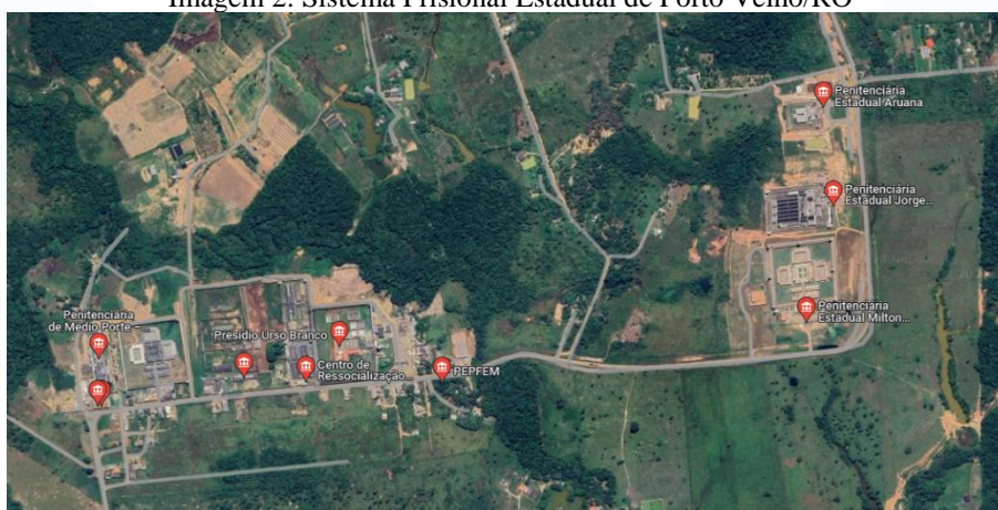
Imagem 2: Sistema Prisional Estadual de Porto Velho/RO