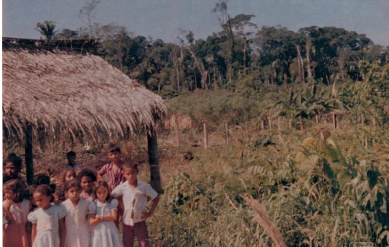
Figura 2: Escola União de Tarilândia no formato de tapiri (1986).