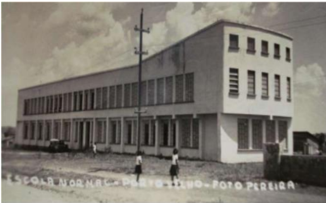
Figura 1: Prédios escolares em Porto Velho, 1960.

discutiu a insuficiência de investimentos e os ônus impostos aos professores, estudantes e a seus familiares. Os professores, nessas escolas rurais precisavam ser polivalentes, e mesmo com maior divisão social do trabalho, em tempos mais recentes, ainda trazem memórias de quando se responsabilizavam pelas múltiplas atividades concernentes à organização dos tempos e espaços escolares: além de ensinar e avaliar, elaboravam o horário, faziam o trabalho administrativo e de secretariado escolar, cuidavam da merenda, da limpeza e da comunicação interinstitucional. Embora progressivamente o Estado tenha investido na Educação Pública, edificando prédios imponentes e contrastantes com a humildade das formas do entorno - como se pode perceber nas imagens apresentadas a seguir - esta realidade não se fez homogênea.