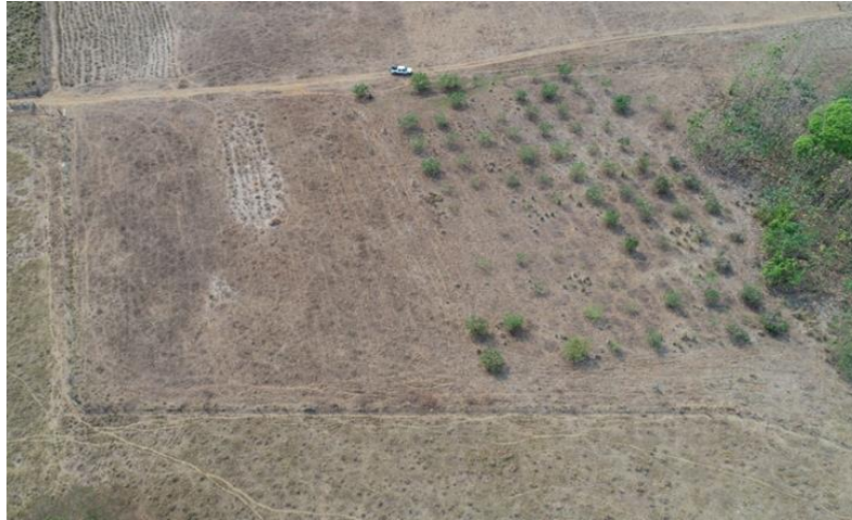
Figura 2 – Área experimental antes do plantio – RO.

3, 4 e parte da 5) e teca (em parte da unidade 5) (Figura 2). A área do plantio comporta 5 blocos com 3 sistemas e 2 parcelas cada.