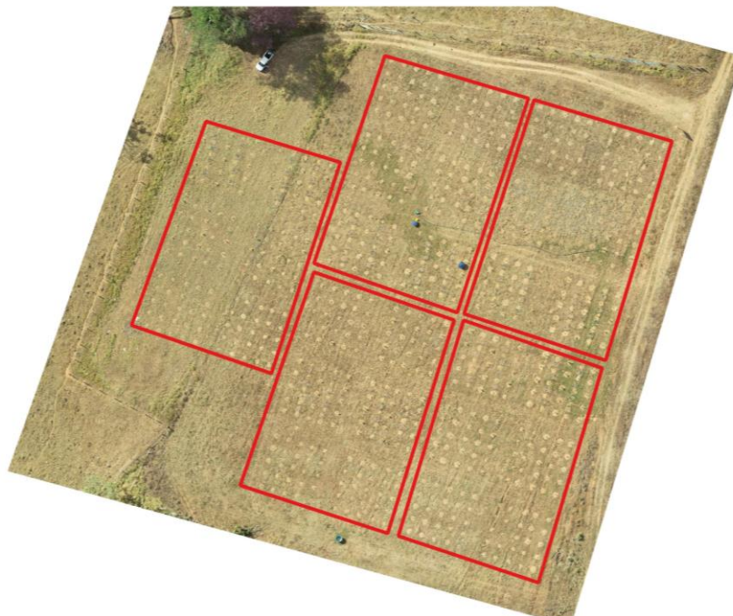
Figura 3 – Área experimental depois do plantio – RO.

O plantio foi concluído no fim de março de 2023 e a condição da área após sua realização, bem como seu arranjo, pode ser visualizado na Figura 3.