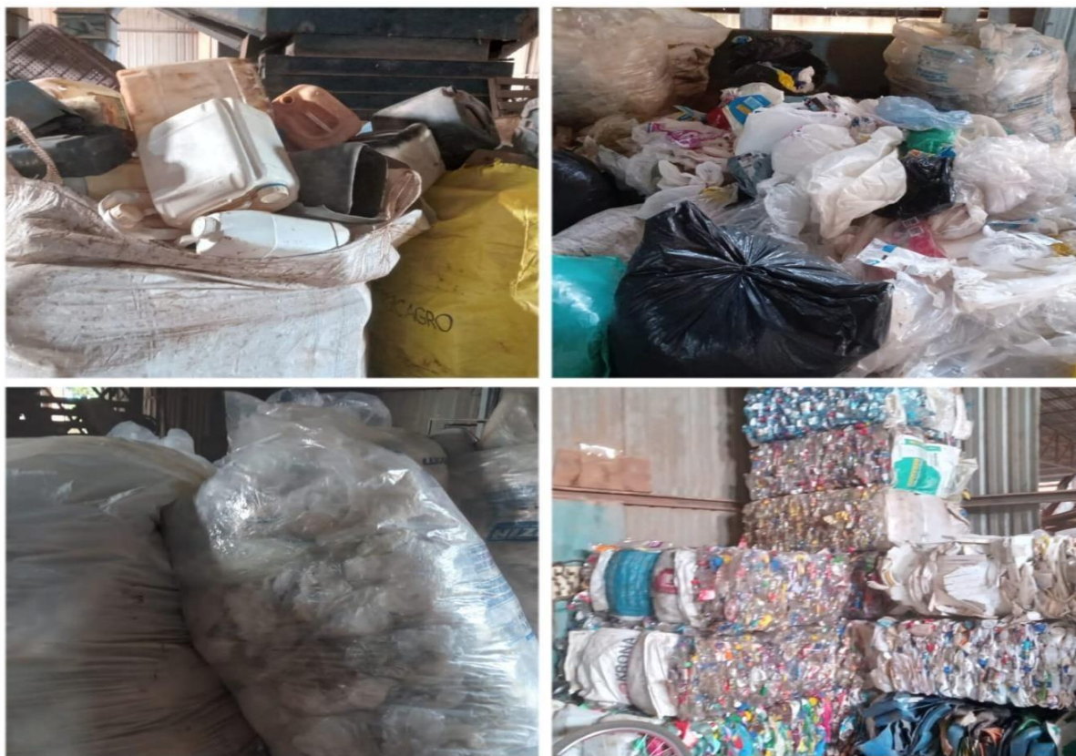
Figura 3- Embalagens plásticas coletados e organizadas pela associação de catadores