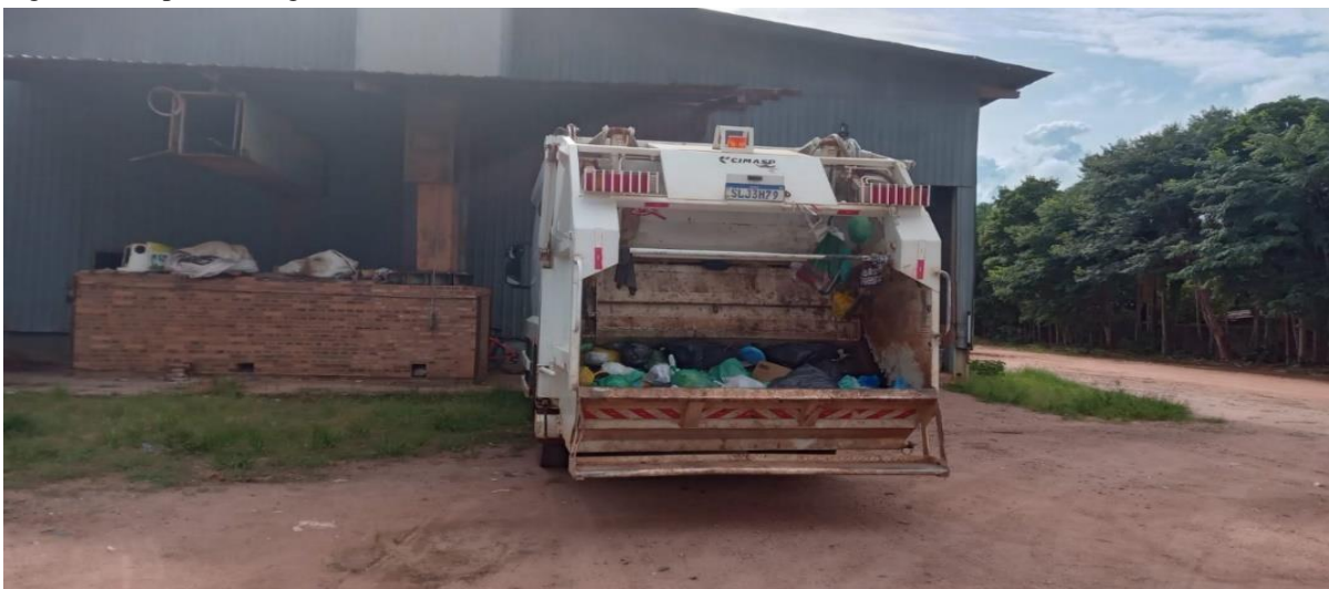
Figura 1- Galpão de triagem da ASSOCCER