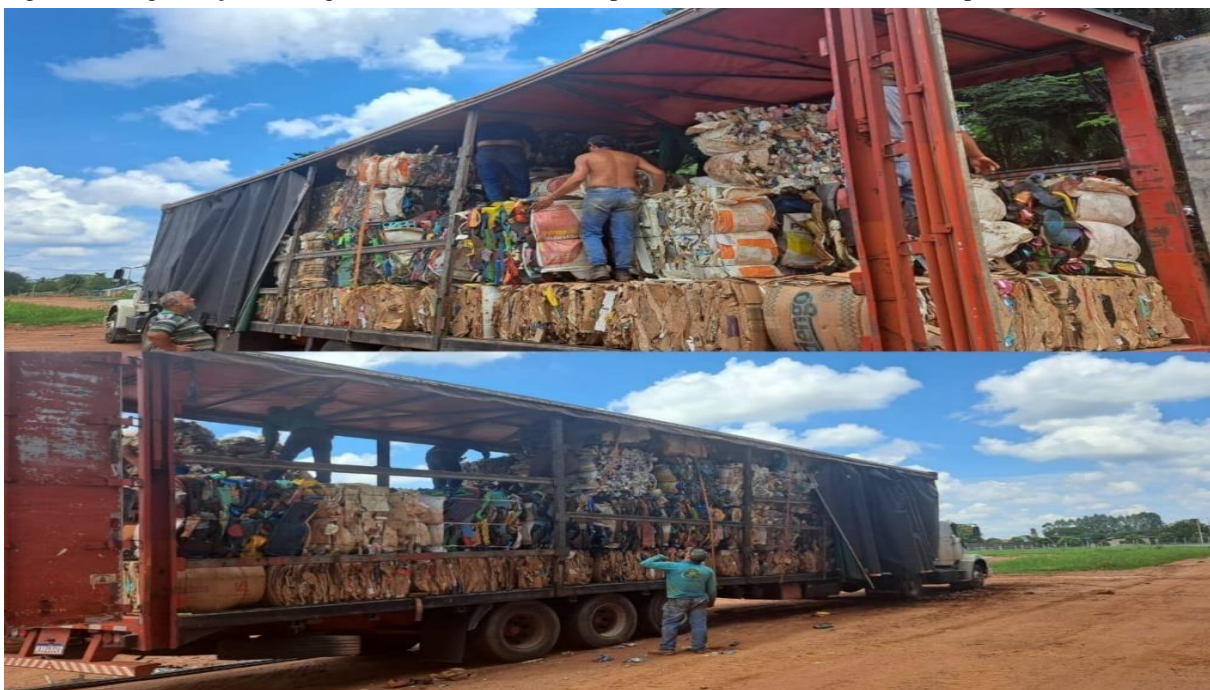
Figura 5 – Organização da carga dos materiais coletados pela ASSOCER em veículo transportador