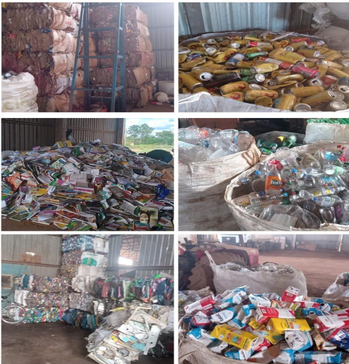
Figura 2- Papéis, latas embalagens plásticas e embalagens longa vida coletados, organizados e dispostos no galpão.