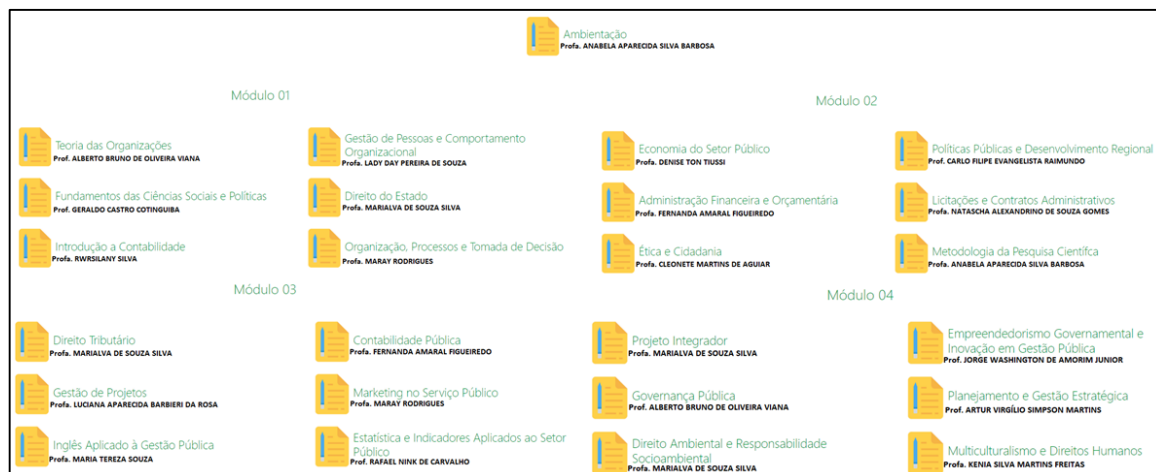
Figura 03. Estrutura curricular do curso Gestão Pública