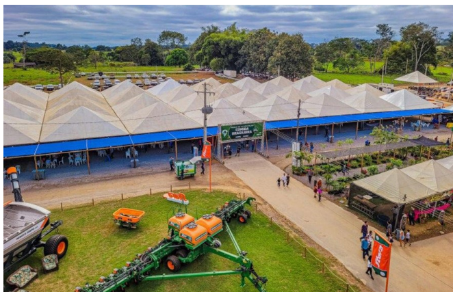
Figura 3 - Centro Tecnológico Vandeci Rack.