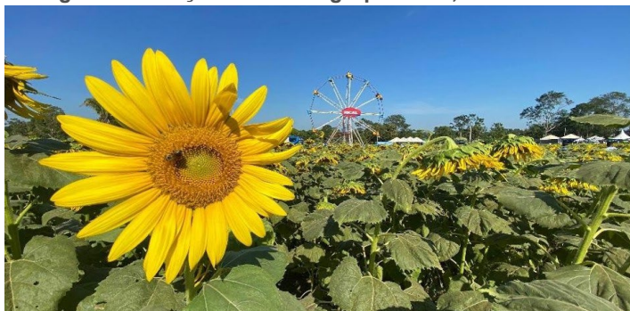
Figura 4 - Atração da Feira Agropecuária, os Girassóis.