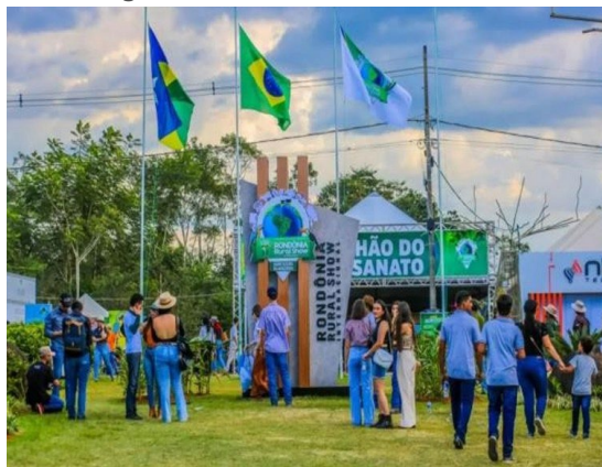
Figura 2 - Imagens da Abertura da Rondônia Rural Show.