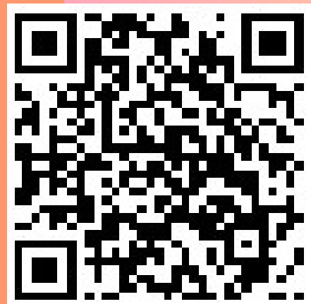
Maria Conceição Evaristo