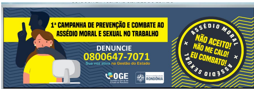
Figura 1- Campanha de enfrentamento ao assédio moral e sexual OGE –RO