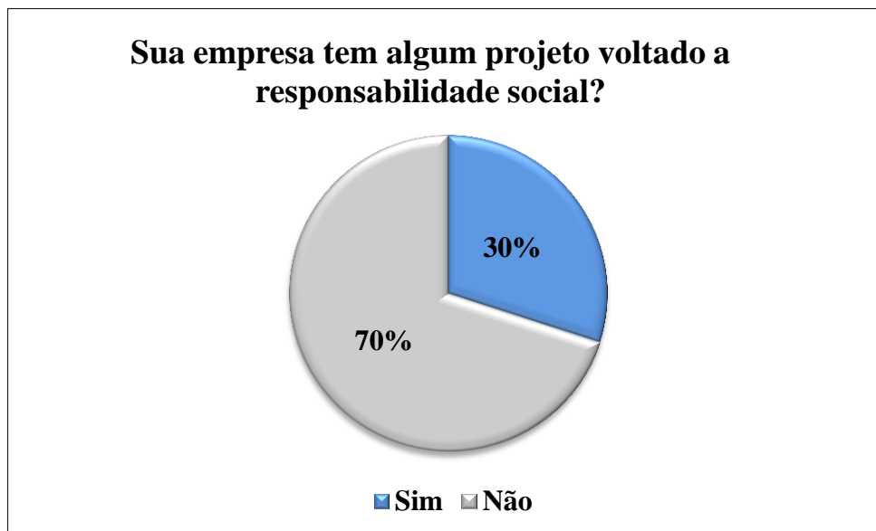
Gráfico 1: Porcentagem de empresas que tem ou não projetos desenvolvidos na área social do município dentro da amostragem pesquisada.