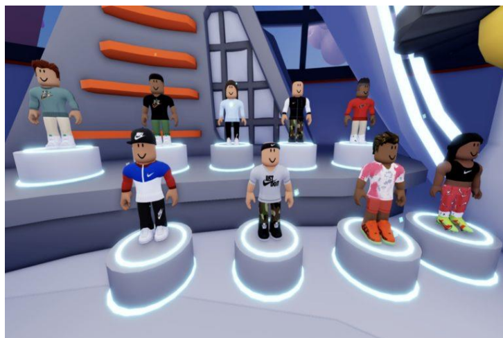
Figura 1 – Exemplo de ambiente comercial no metaverso (Nikeland no Roblox).