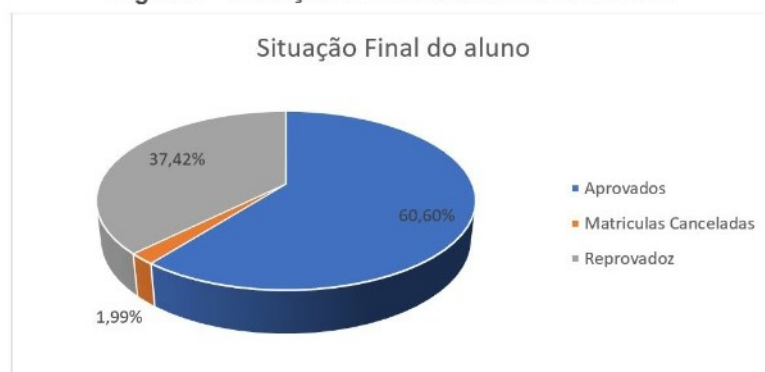
Figura 3 – Situação dos alunos ao final do curso.