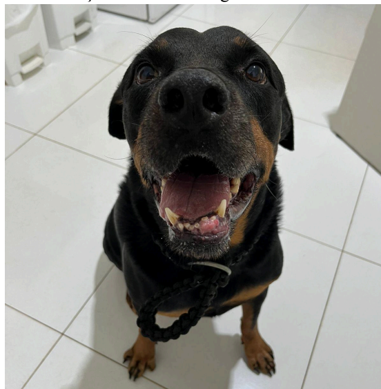
Figura 1: Presença de nódulo na região inferior do lado esquerdo.

No exame físico, foram avaliados os parâmetros vitais, com frequência cardíaca de 119 batimentos por minutos (bpm), frequência respiratória de 25 movimentos por minuto (mpm) e temperatura de 38,9°C, todos dentro dos valores normais para a espécie (Feitosa, 2020). O tempo de preenchimento capilar era de 2 segundos. A mucosa ocular apresentava-se normocorada, enquanto na cavidade oral observou-se a presença de um nódulo de crescimento irregular, medindo aproximadamente 1 cm (Fig.1).