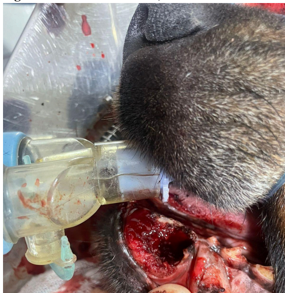
Figura 3. Exérese do nódulo, um canino e um incisivo.