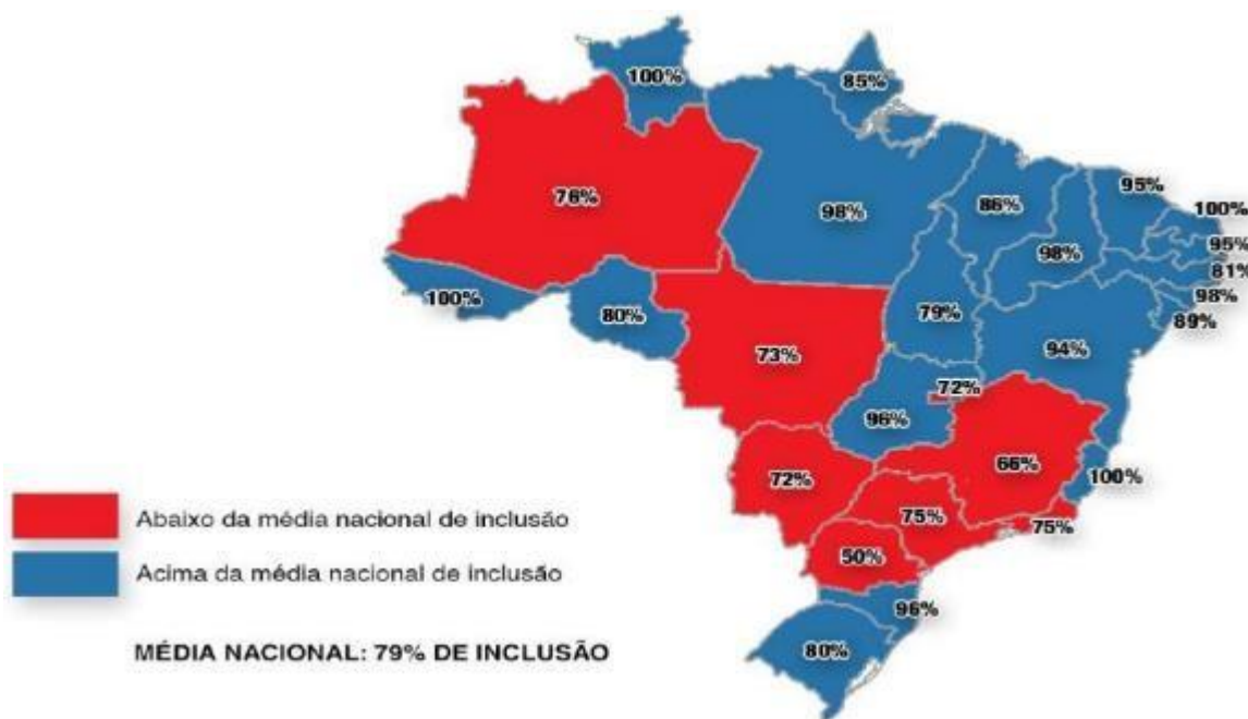
Figura 01: Taxa de inclusão dos estudantes com deficiência na Educação Básica