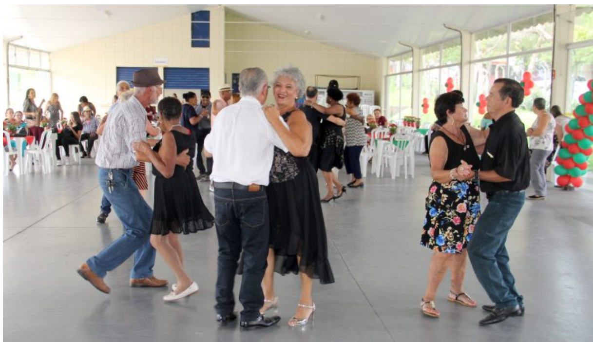
Imagem 4: Baile da terceira idade

Fonte: Site O Regional Foto: Ivair Oliveira, 2020 6 .