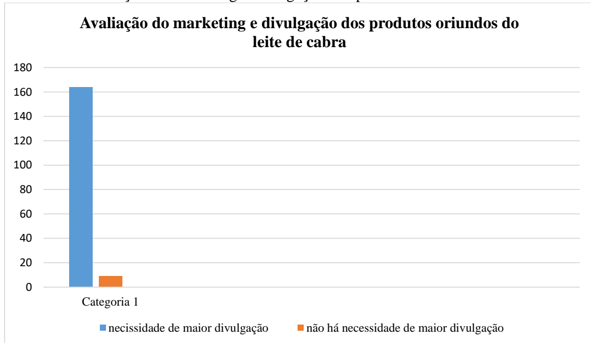
Gráfico 2: Avaliação do marketing e divulgação dos produtos oriundos do leite de cabra.

Quando questionados sobre a necessidade de maior divulgação e marketing dos produtos oriundos da caprinocultura, 93,71 % afirmaram ser necessário uma maior divulgação e 5,14 % dos indivíduos disseram não considerar necessário (Tabela 7). Os dados obtidos corroboram com os encontrados por Magalhães et al. (2016), onde os entrevistados propuseram que o leite de cabra fosse mais divulgado, em relação a suas propriedades e benefícios à saúde humana.