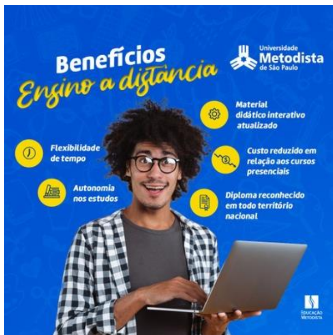
Figura 3: Benefícios do ensino EAD.

O Banner seguinte tem como objetivo apresentar as qualidades do ensino EAD, foi criada pela Universidade Metodista de São Paulo.