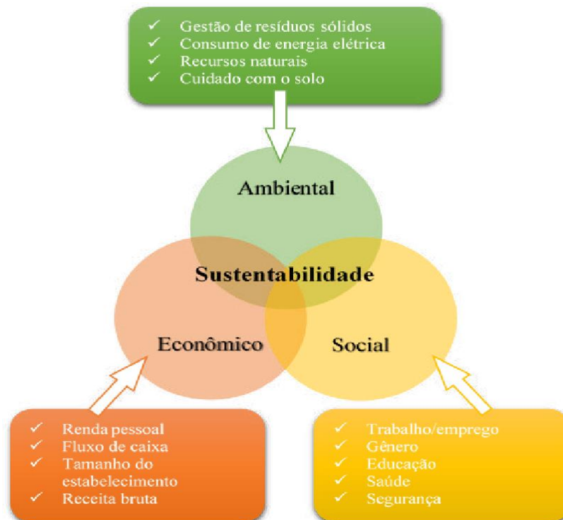
Figura 1: Tripé da Sustentabilidade