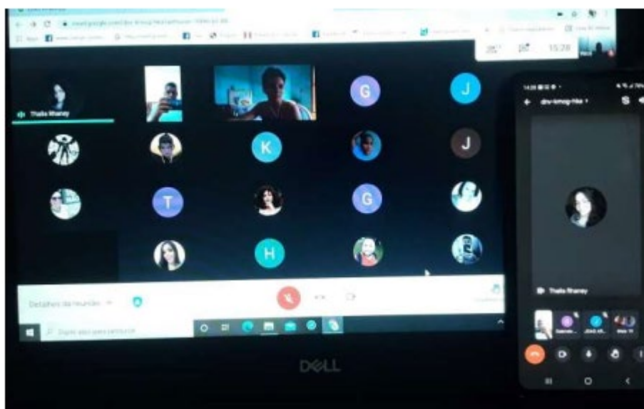
Figura 2: Momento de realização de uma aula Meet.

Portanto o fato da observação é importante no meio educacional, onde o professor pode analisar investigar e estudar novos métodos em busca de melhoramento nas ideias para se obter um aprendizado mais relevante. A partir da figura 2, observa-se a participação dos alunos durante as aulas no Google Meet. Este momento é crucial para observar também quais os pontos que os alunos apresentam mais dificuldades durante as aulas.