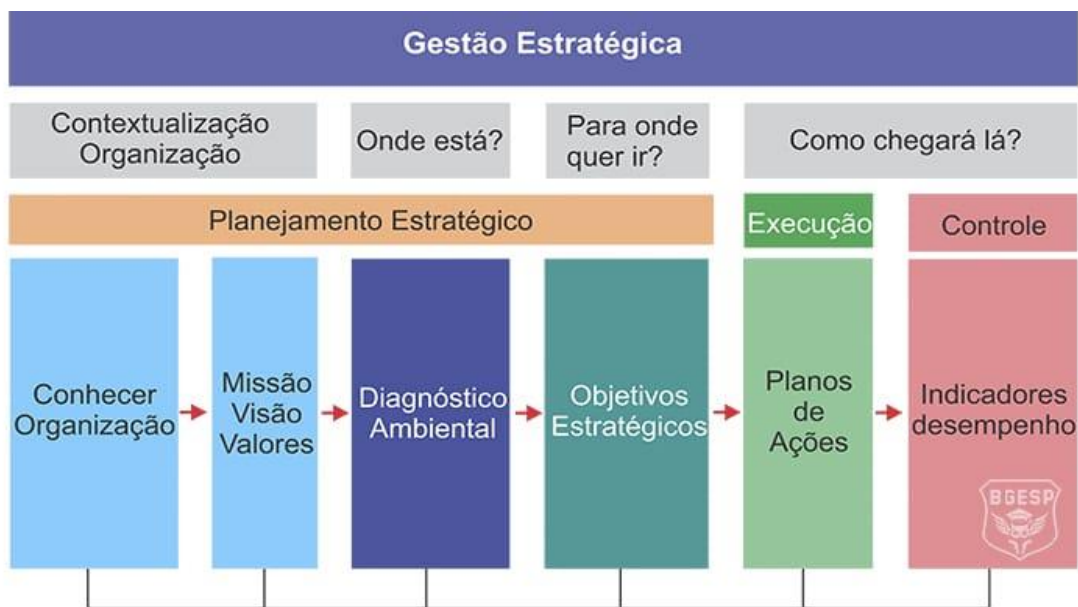
Figura 1: Denota-se a visão estratégica a nível organizacional.