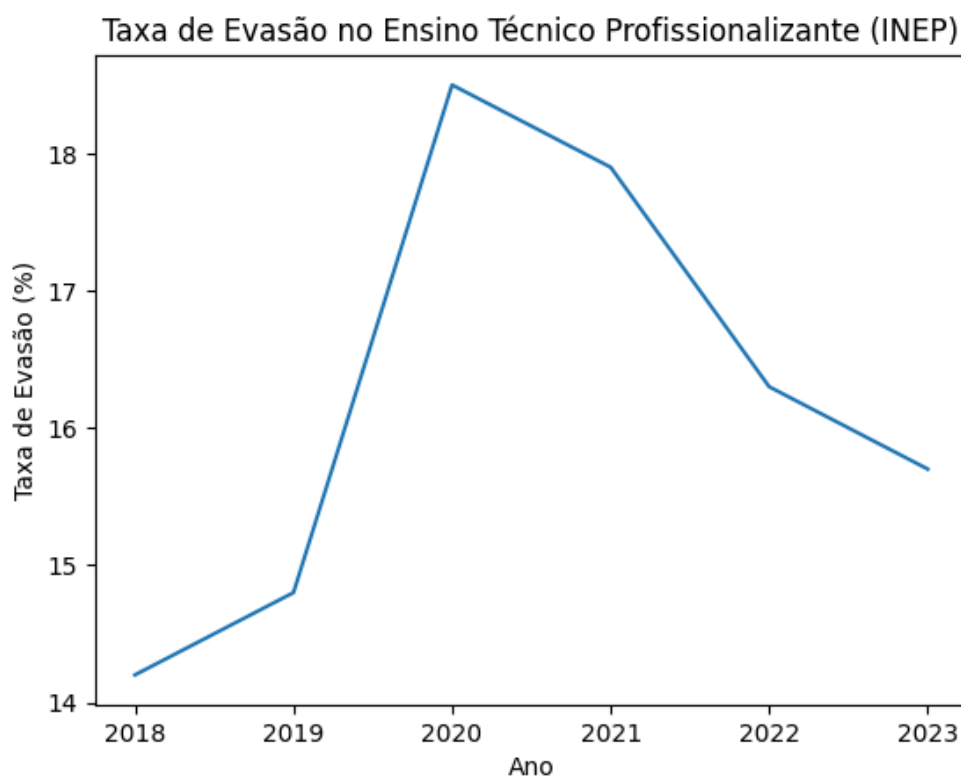
Gráfico 1 - Evolução da taxa de evasão no ensino técnico profissionalizante entre os anos de 2018 e 2023.