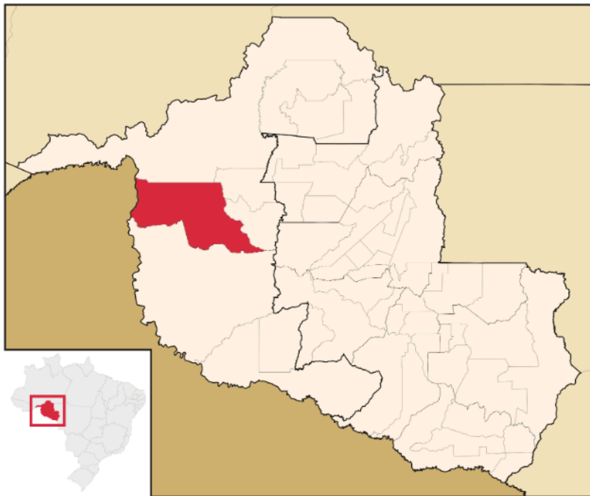
Figura 2- Extensão territorial.

Extensão territorial, população absoluta, postos de saúde que possui IDH