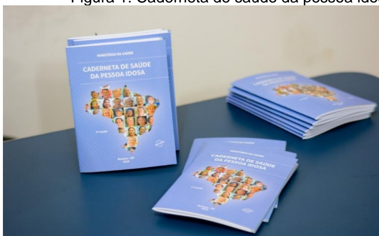
Figura 1: Caderneta de saúde da pessoa idosa